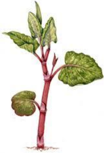
Reynoutria japonica Invasiv