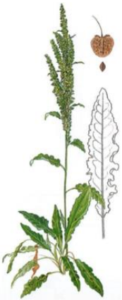
Rumex longifolius Ej invasiv